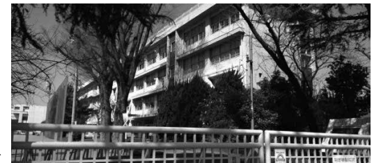
学校のイメージ写真▶